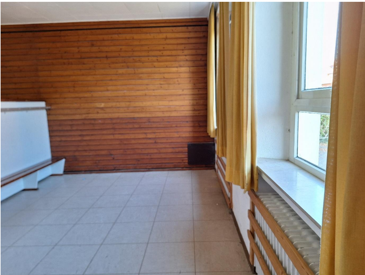
Innenraum EG Umkleide