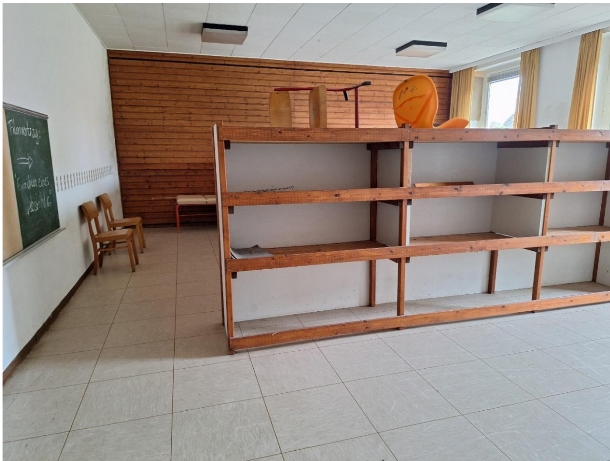
Innenraum EG Umkleide