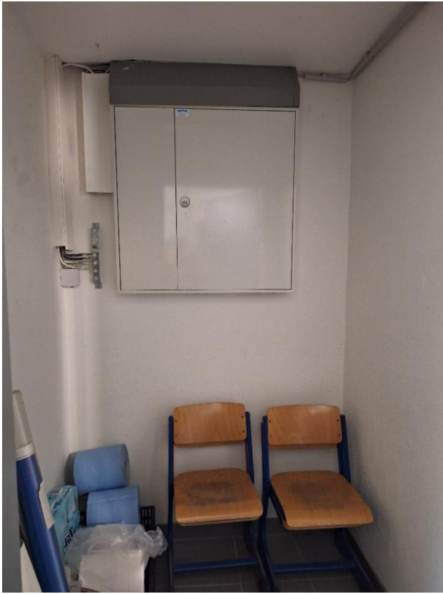
Keller – Verteilung