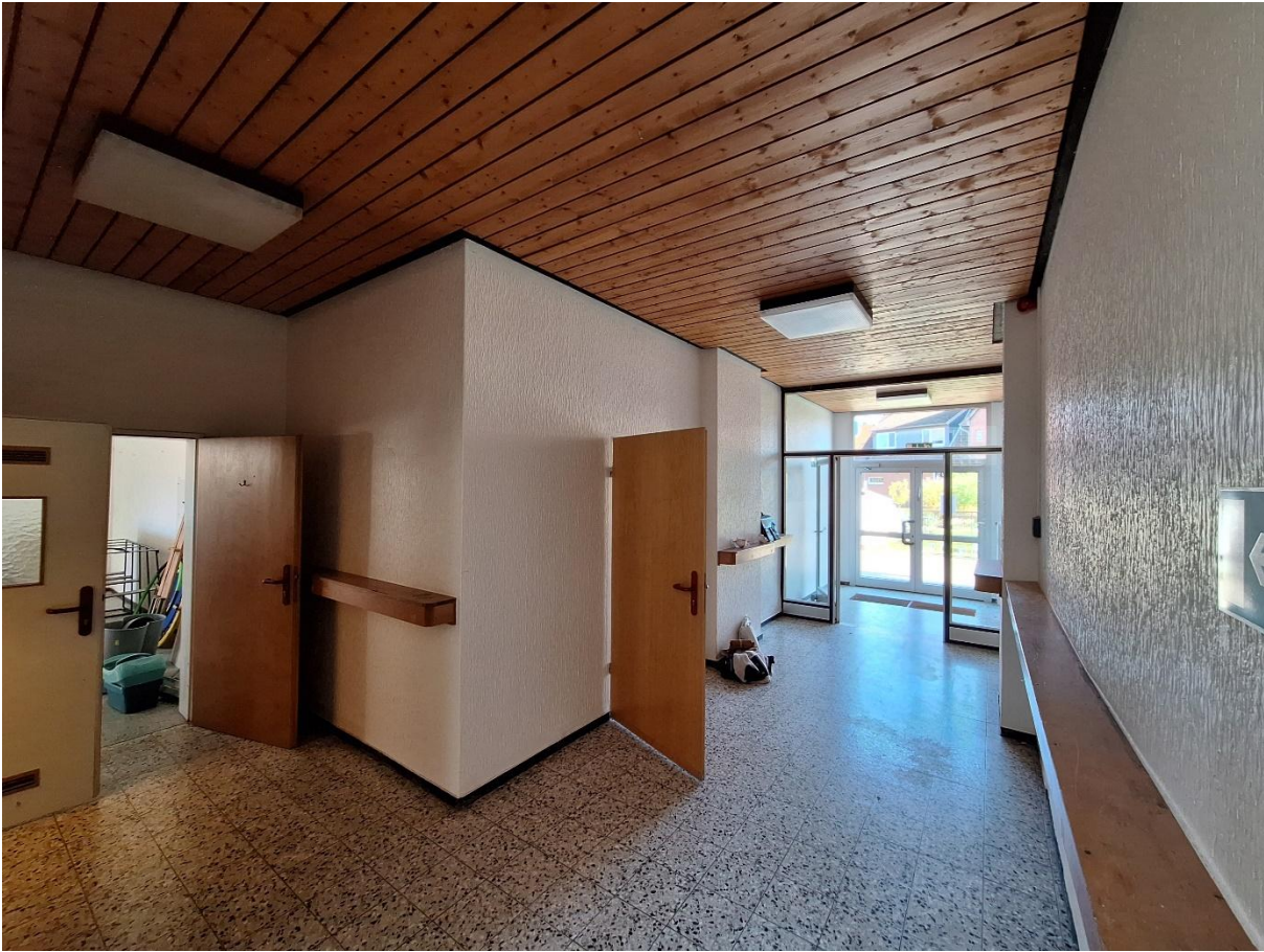
Innenraum Flur EG