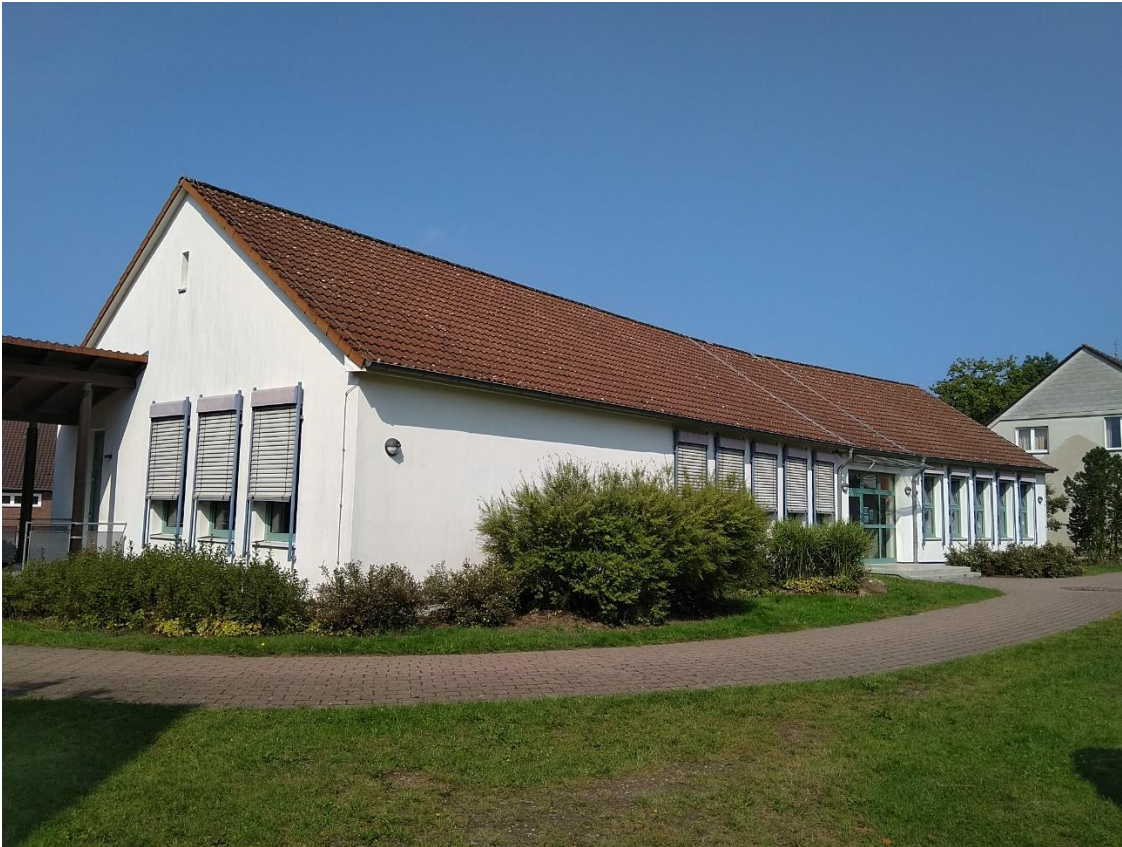
Ansicht vom Schulhof- Eingänge