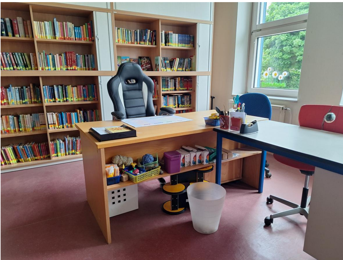
Bibliothek mit geöffneten Schränken