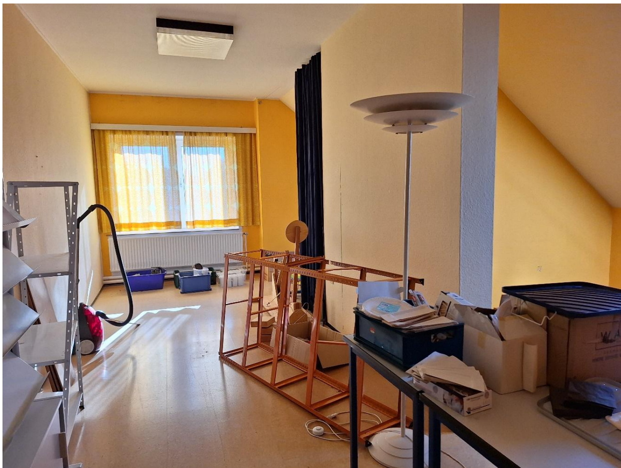
Archiv / Lagerraum OG