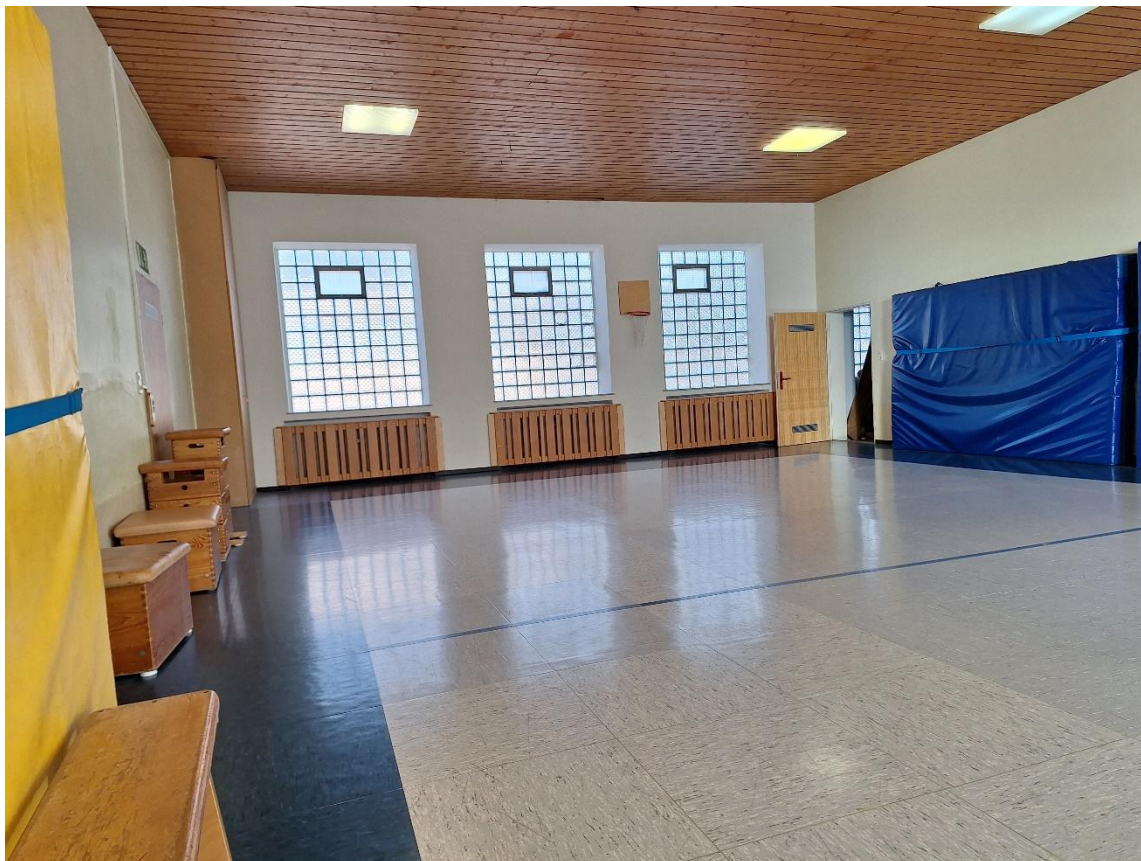
Innenraum EG Turnhalle