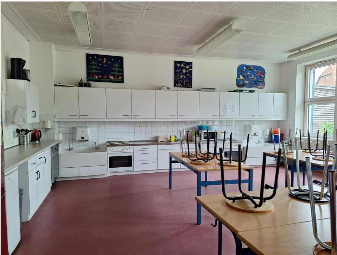
Küchenbereich / Essraum und Werkraum