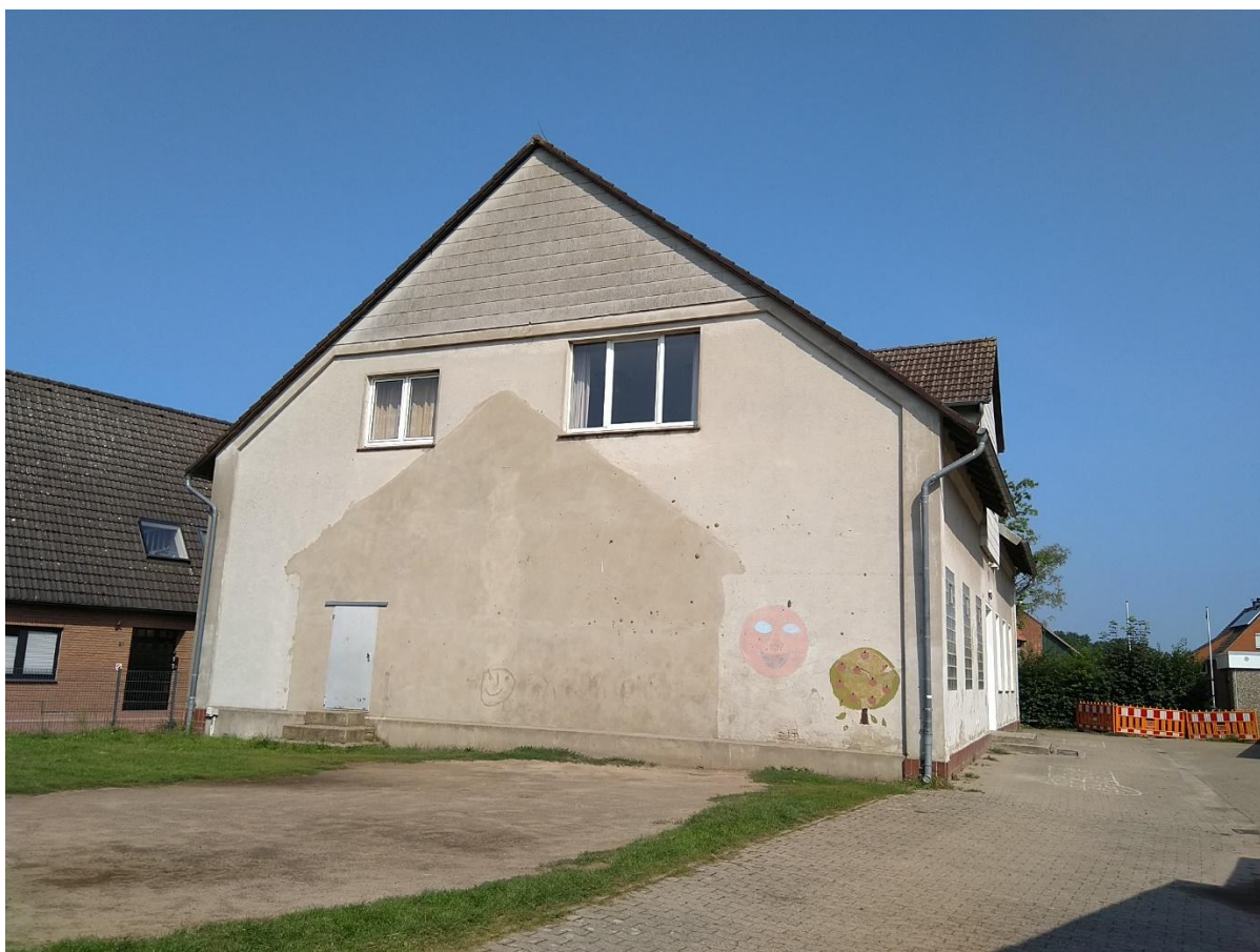
Ansicht vom Bolzplatz/ Schulhof