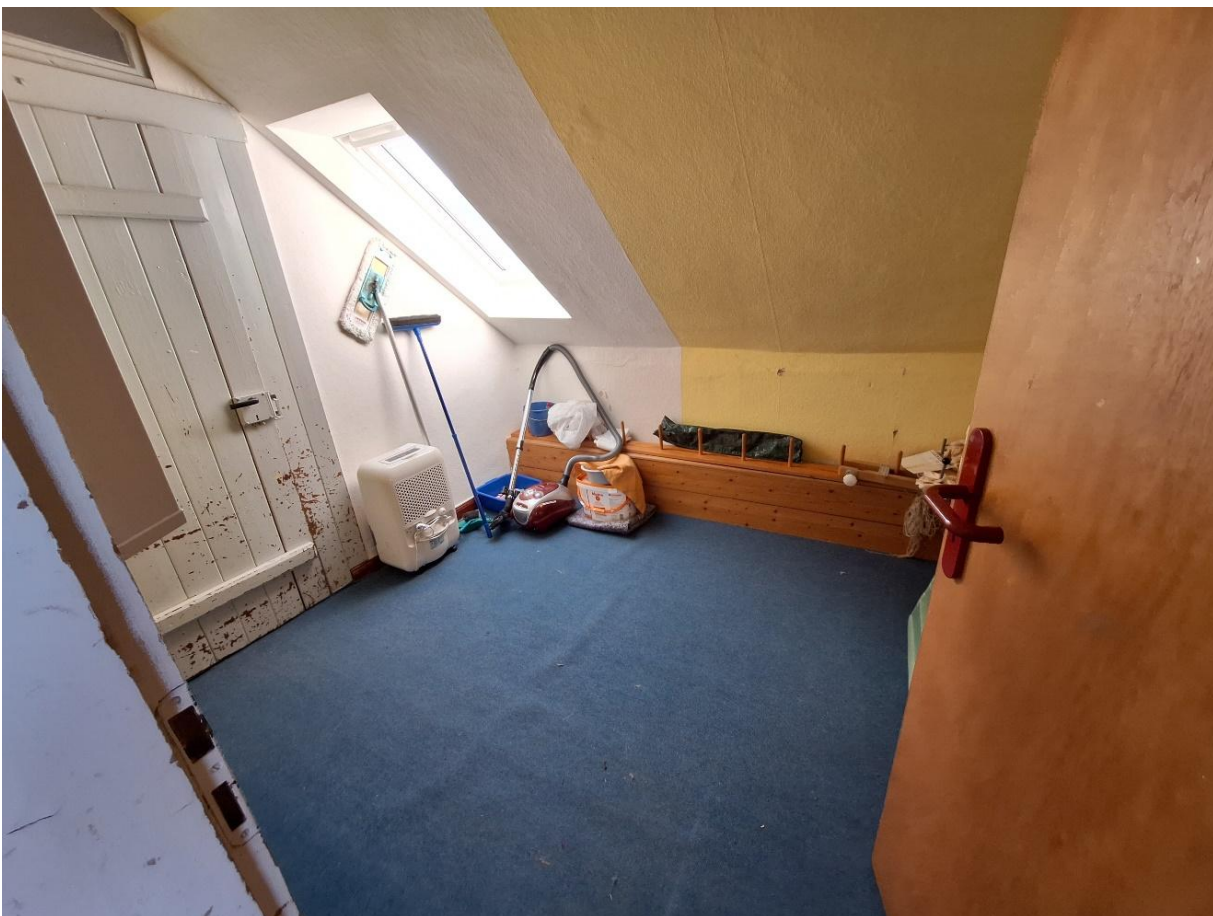
Ungenutzter Raum OG