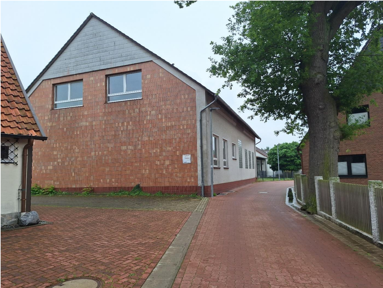
Ansicht von Klosterstraße