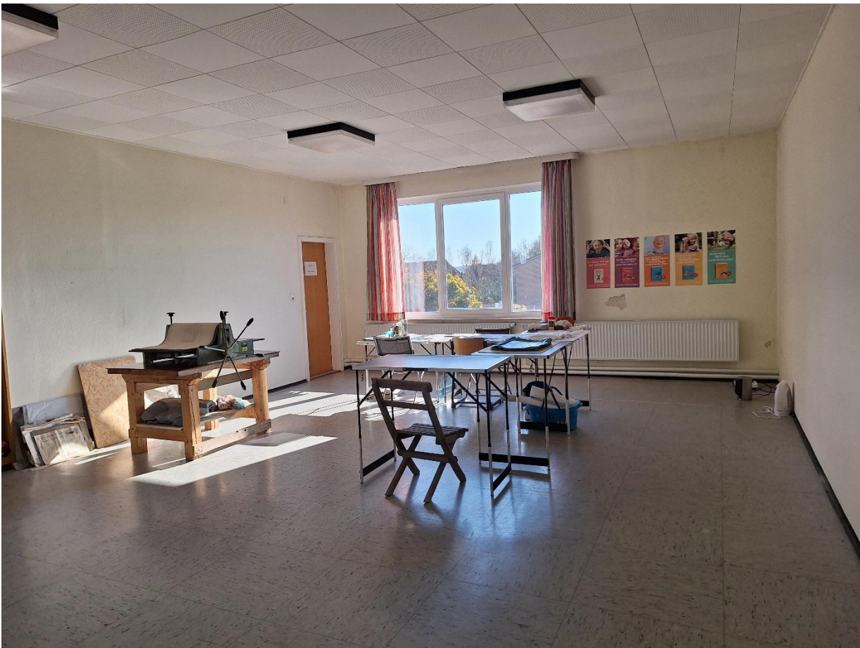
Innenraum OG Ehem. Klassenraum