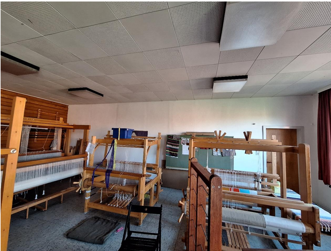
Innenraum Webstube OG