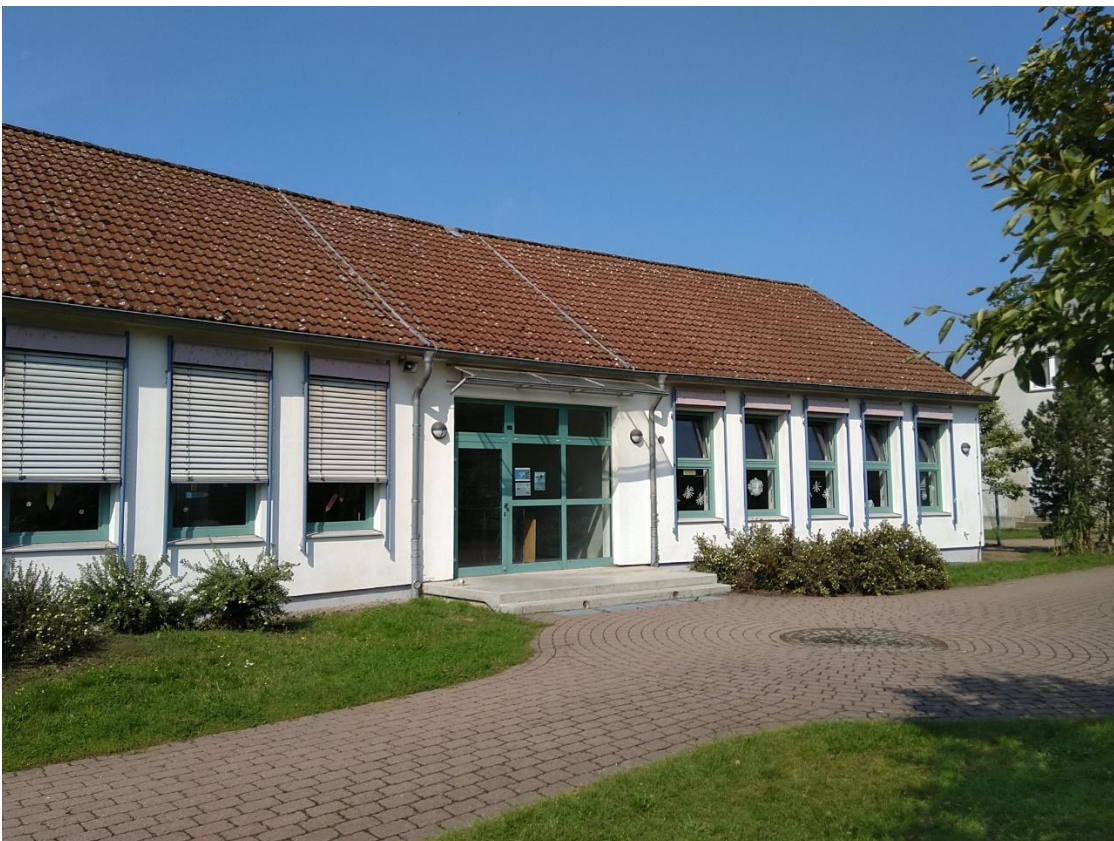
Ansicht vom Schulhof