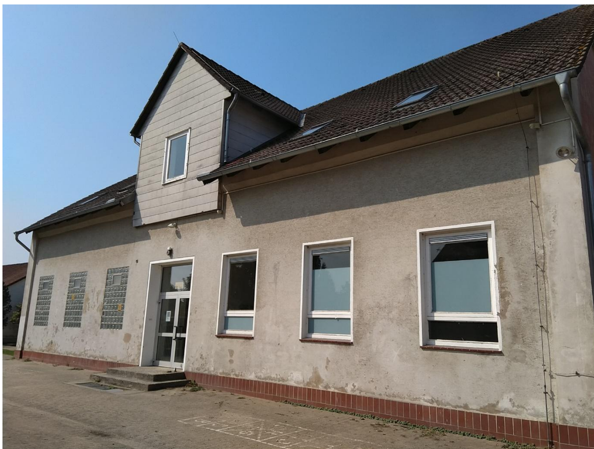
Ansicht Eingang Schulhof