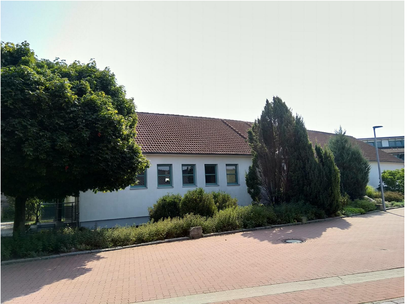
Ansicht von Klosterstraße