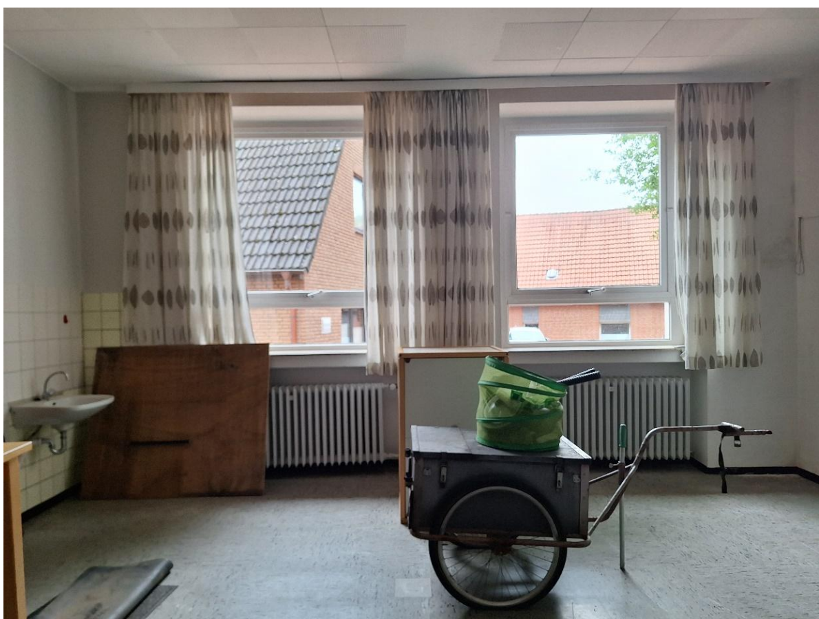
Innenraum EG Abstellraum