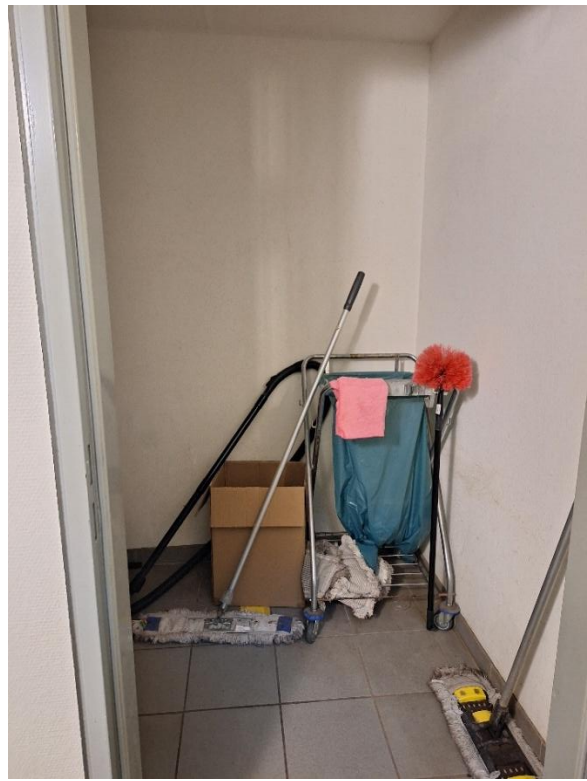
Keller - Putzraum